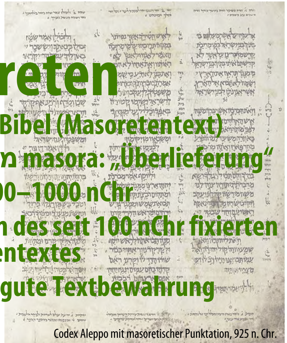
Codex Aleppo mit masoretischer Punktation, 925 n. Chr.