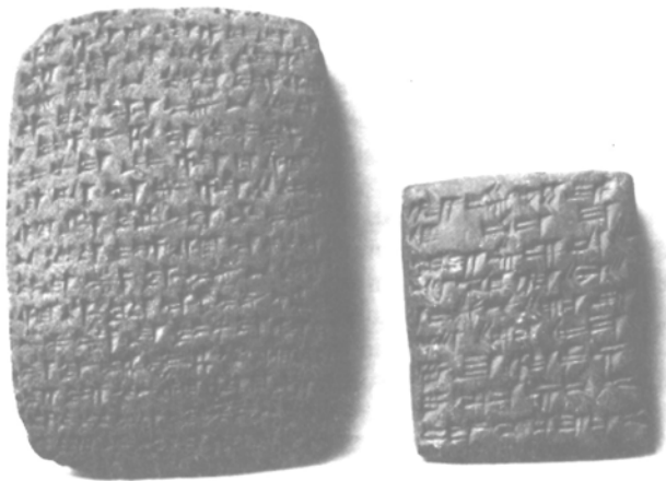
Zwei Amarna-Briefe. Diese Briefe (es gibt etwa 300 von ihnen) sind Hilferufe der Fürsten Palästinas an die Könige Ägyptens (ca. 1400-1350 v. Chr.) und geben möglicherweise ein Bild der Zustände in Palästina während der Landnahme.

Zweitens darf nicht übersehen werden, daß etliche Briefe ganz klar den Eindruck vermitteln, daß die Ḫabiri in großer Zahl ins Land einfielen und gerade dabei waren, weite Landstriche zu erobern.