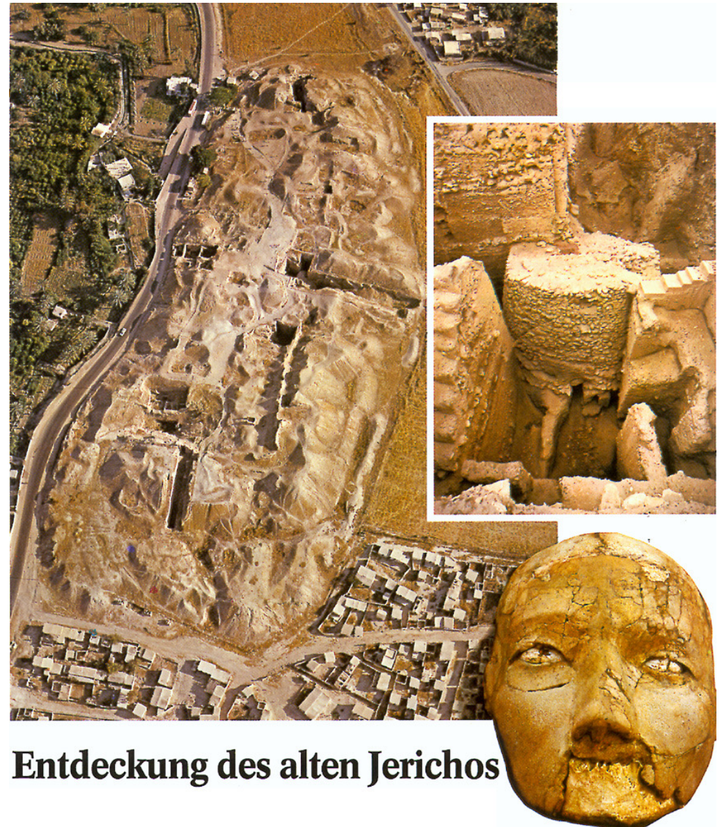
Entdeckung des alten Jerichos